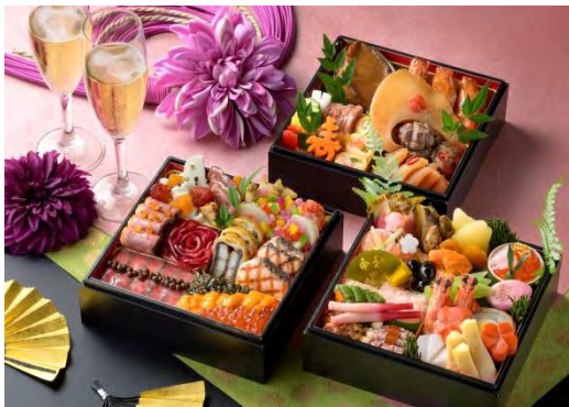
プレミアムおせち