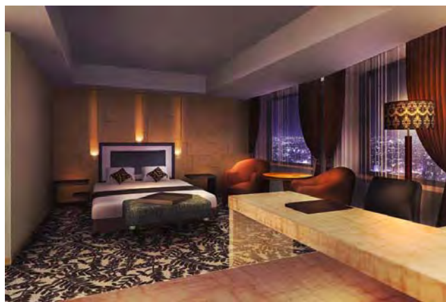
エグゼクティブダブルルーム(イメージ図)

シンプルモダンをベースに、モチーフやカラーをプラスした、新しいくつろぎの空間を展開します。クラウンプラザのグローバルスタンダードに基づき、客室の仕様の変更も行います。