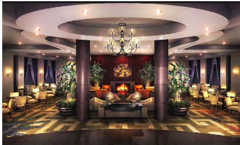
スターゲイト(イメージ図)

最上階のスターゲイトに到着すると、目の前には、眺望が広がり、足元に「GRAND GATE TREE」の梢をイメージした空間が開けます。