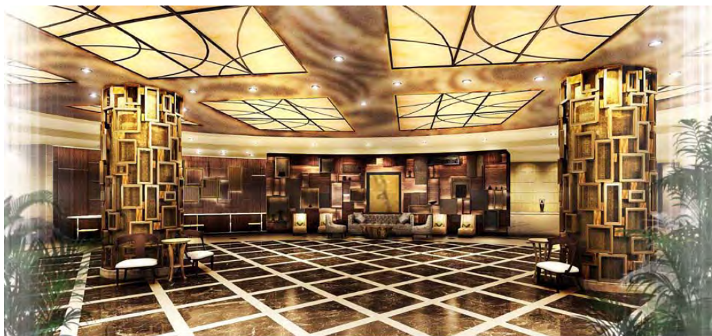
1Fメインロビー(イメージ図)

ロビー中央の2本の柱を、一対のシンボルツリーに見立てた「GRAND GATE TREE」が、ゲストをお迎えします。