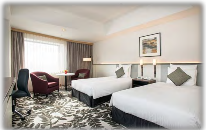
◇スタンダードツインルーム(34㎡)