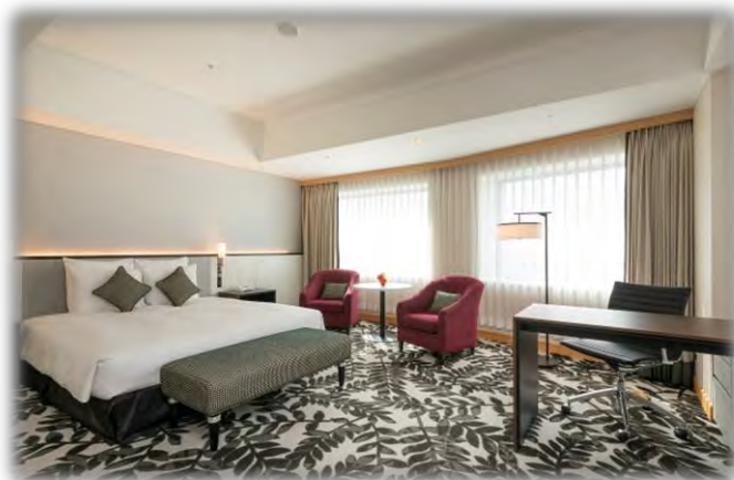
◇エグゼクティブダブルルーム(42㎡)