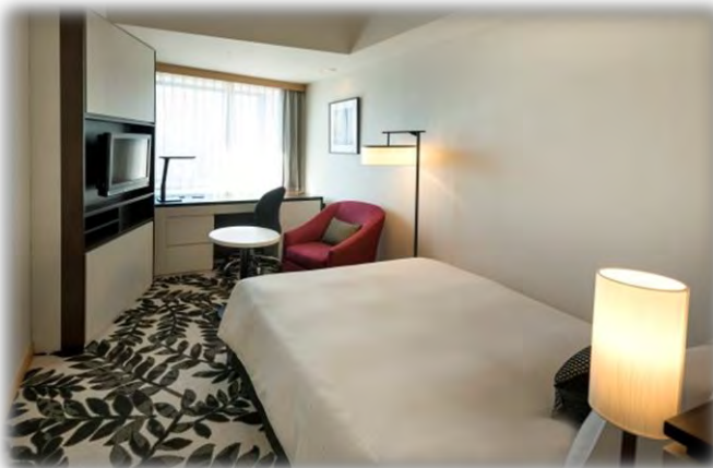
◇スタンダードダブルルーム(24㎡)