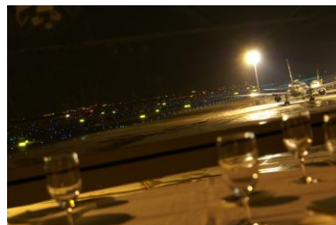
セントレア「クイーン・アリス」