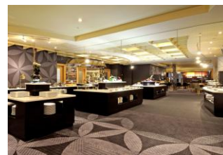
2F「オーキッドガーデン」