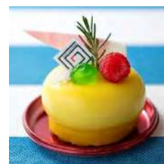
◎シークワーサーココ ¥600