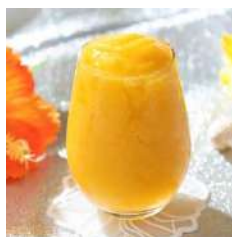
◎沖縄こいのマンゴー パインジュース ¥1,300

沖縄県の特産品「シークワーサー」や「マンゴー」、「パイナップル」などを使用したパティシエ特製のスイーツやドリンクをお楽しみいただけます。