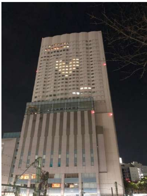
ホテル北側建屋全景